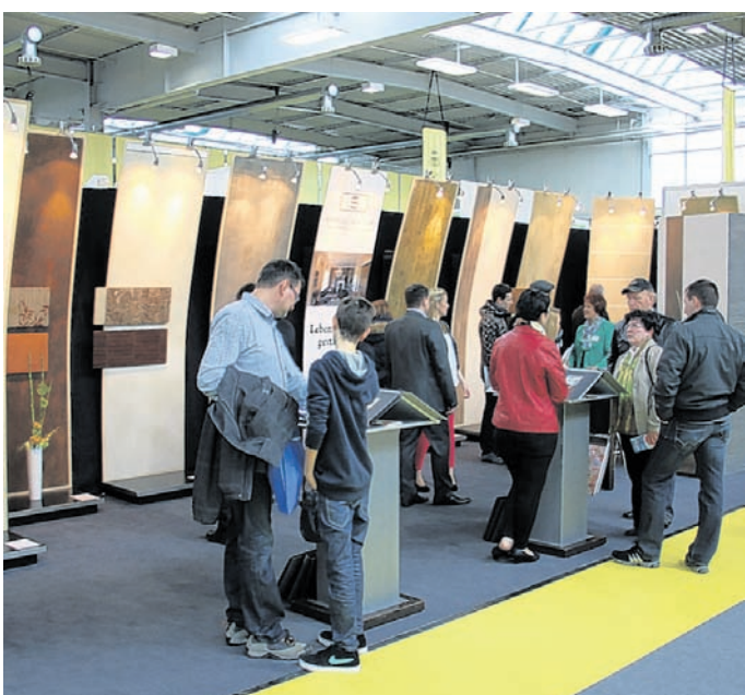
Neuigkeiten und Trends zum Thema Holzbau – auf den beiden Messen kann man sich schlau machen.

➔ Weitere Infos im Internet www.immobilitage-augsburg.de www.messe-im-lot.de