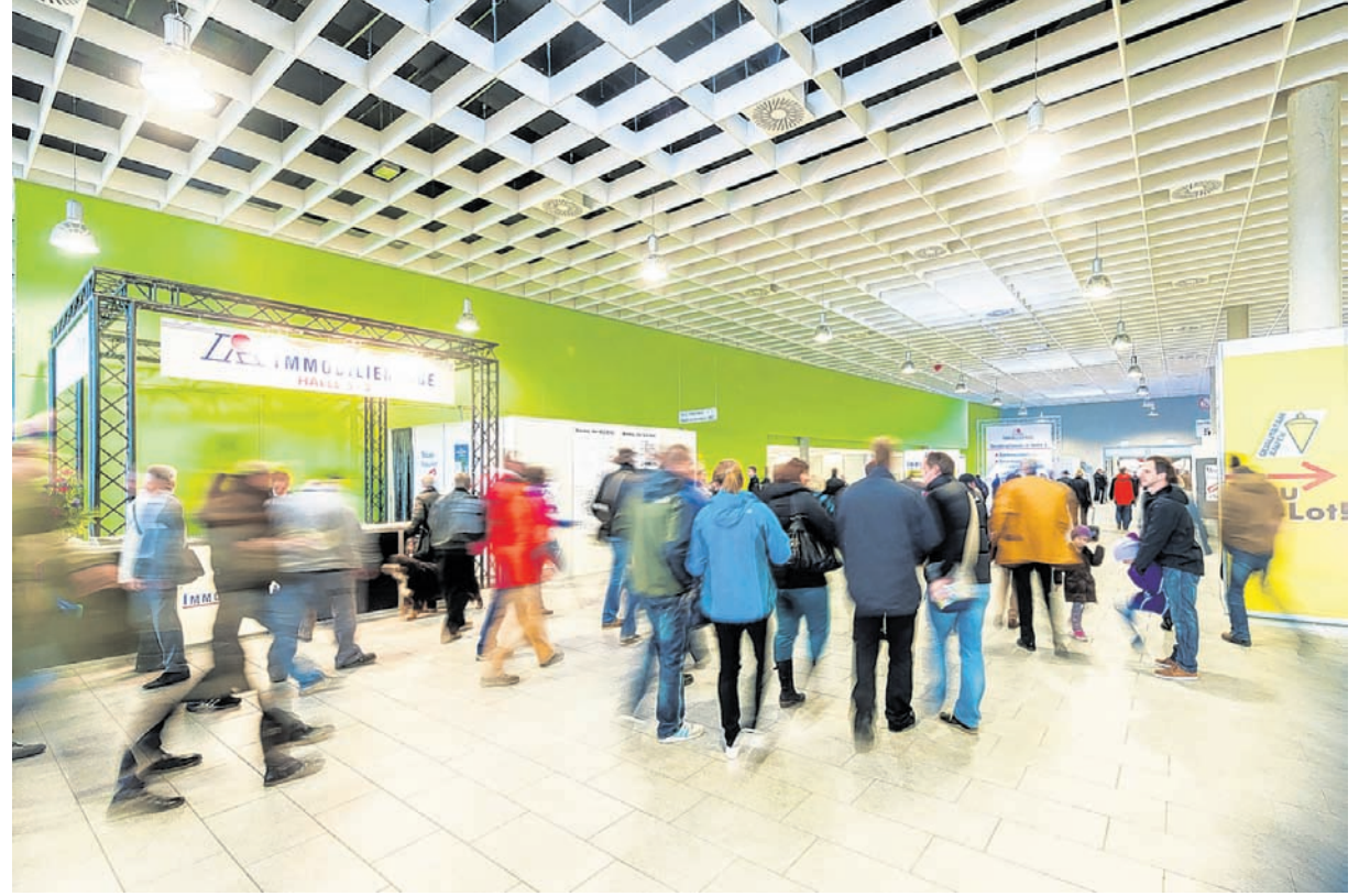
In den Hallen 3, 5, 6, und 7 erfahren die Besucher alles Wissenswerte rund um die Themen Immobilien, Bau und Finanzierungsmöglichkeiten.