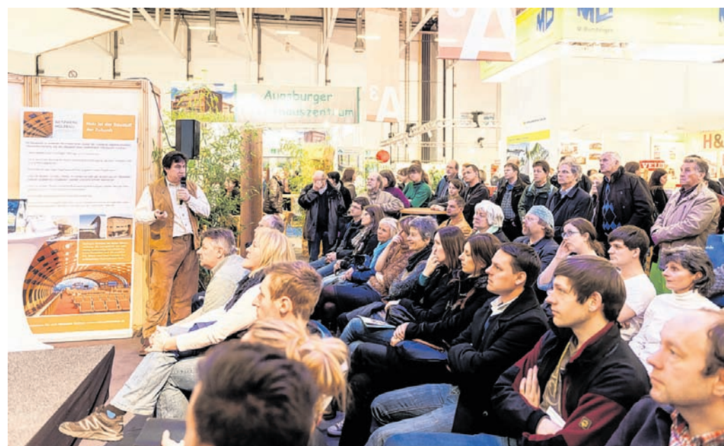
Spannende Vorträge warten auf das Publikum der Augsburger Immobilitage sowie der Bau im Lot. Das komplette Programm findet man in der App oder online.