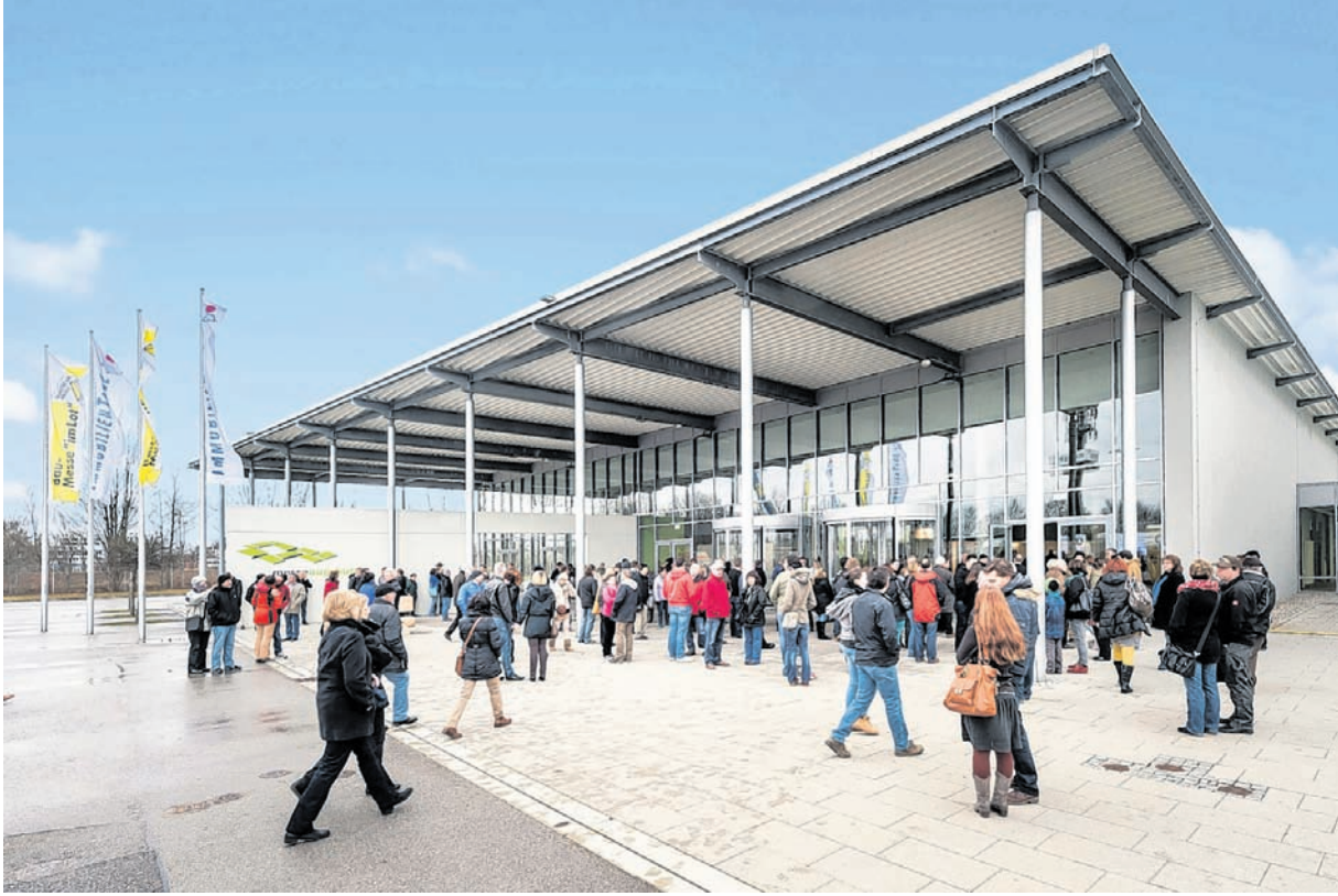
Großer Andrang herrscht traditionell, wenn die beiden Messen ihre Pforten öffnen. Kein Wunder, an den drei Messetagen gibt es schließlich einiges zu entdecken.