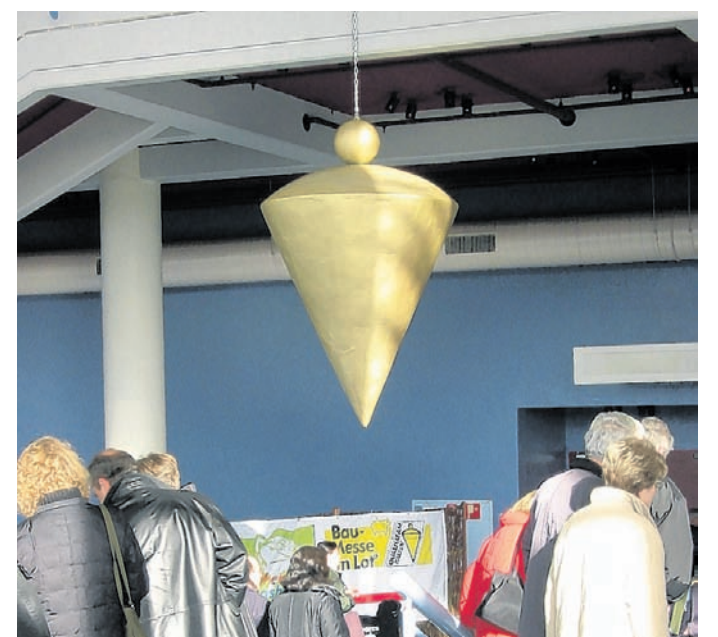
Symbol für Qualität: Das goldene Lot ist das Gütesiegel des Vereins „Qualität am Bau“.

| Eigenheime | Immobilien | Finanzierungen | Handwerk | Bauen | Sanieren | Energie sparen